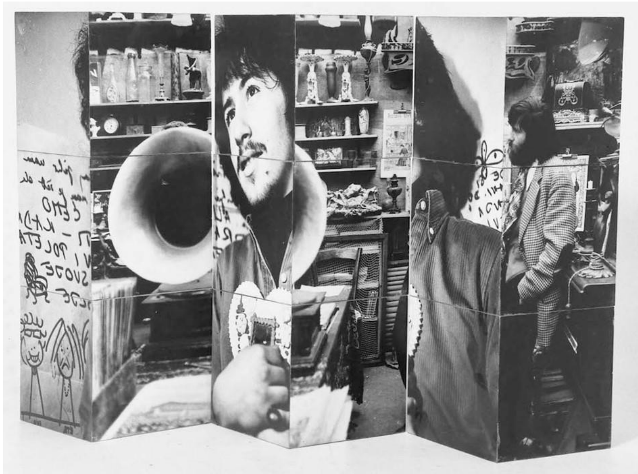
PETAR DABAC, KOCKA, 1970.

četiri fotografije. Snimci kao da su uzeti iz policijske kartoteke, što djeluje vrlo provokativno, i neizbježno asocira na izmjenu osobnog izgleda i identiteta.