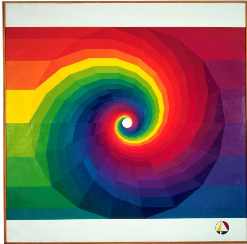
VJENCESLAV RICHTER, SIS 4, 1975.

Vjenceslav Richter je istraživač novih mogućnosti u području urbanizma, arhitekture i vizualnih umjetnosti. Njegovo je cjelokupno stvaralaštvo zaokupljeno jednom temeljnom idejom – sintezom svih umjetnosti. Vlastitu vilu na Vrhovcu 38, zajedno s umjetničkim radovima, a danas poznatu pod nazivom Zbirka Richter – umjetnik i njegova supruga darovali su Gradu Zagrebu s namjerom osnutka mjesta na kojem će se proučavati konstruktivna umjetnost i okupljati mladi umjetnici, a kako bi potaknuli širenje kulturnih sadržaja izvan užeg središta grada. Zbirkom Richter danas upravlja MSU, a između dvjestotinjak djela ovog impresivnog arhitekta, dizajnera i grafičara nalaze se i slikarski radovi u kojima promišlja sintezu i sistem. Sistemsko slikarstvo proizlazi iz Richterove pobune protiv pravog kuta i želje da gledateljima približi druge kutove koji se u pravilu rijetko upotrebljavaju. Stvorio je alat, trokute bez pravog kuta kojima je počeo crtati geometrijske crteže sastavljene od kutova u otklonu prema određenom zadanom sistemu. Ti crteži postat će osnova sistemskog slikarstva u kojem nastaje dvadesetak ulja na platnu sredinom sedamdesetih godina 20. st., među kojima i SIS 4.