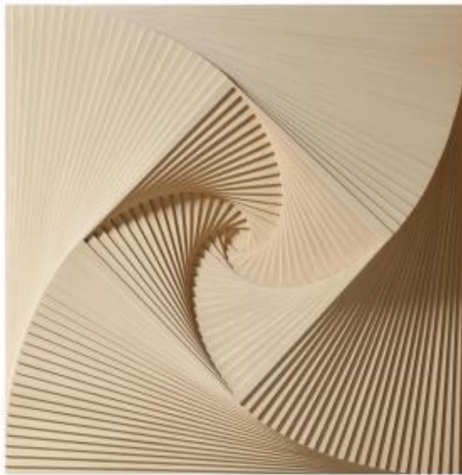
JURAJ DOBROVIĆ, Prostorna konstrukcija, 1968.

Juraj Dobrović tvrdi da je nešto otkriti u (modernoj, suvremenoj) umjetnosti, gdje se čini gotovo sve postignuto, znatan zahtjev prema samome sebi i vrlo vrijedan doseg ako je neko pravo otkriće zaista obavljeno. Također nastavlja kako se u otkrivanju treba prepustiti rastu djela što bi značilo da samo djelo vodi umjetnika iz jednog rješenja u svako drugo sljedeće rješenje.