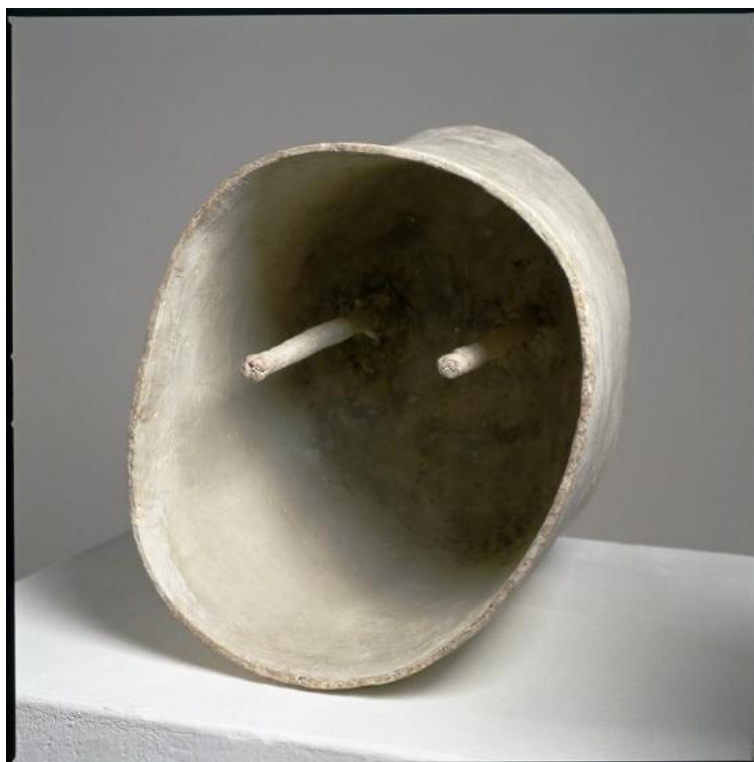
IVAN KOŽARIĆ: UNUTRANJE OČI, 1959./1960.

Kožarićev apsurdan i duhovit prijedlog za izvedbu kolektivnog djela u duhu Gorgone bio je: „kolektivno učiniti odljeve u gipsu unutrašnjosti glava svih gorgonaša, nitko ne može biti oslobođen. Učiniti diskretno odljeve unutrašnjosti nekoliko značajnih automobila, unutrašnjosti garsonijera, stabala, unutrašnjosti jednog parka itd. Uglavnom svih značajnih šupljina u našem gradu.“ 2 Da za Kožarića skulptura nije samo tijelo u prostoru, nego i prostor u tijelu svjedoči njegovo antologijsko djelo Unutarnje oči koje je nastalo za vrijeme njegova boravka u Parizu.