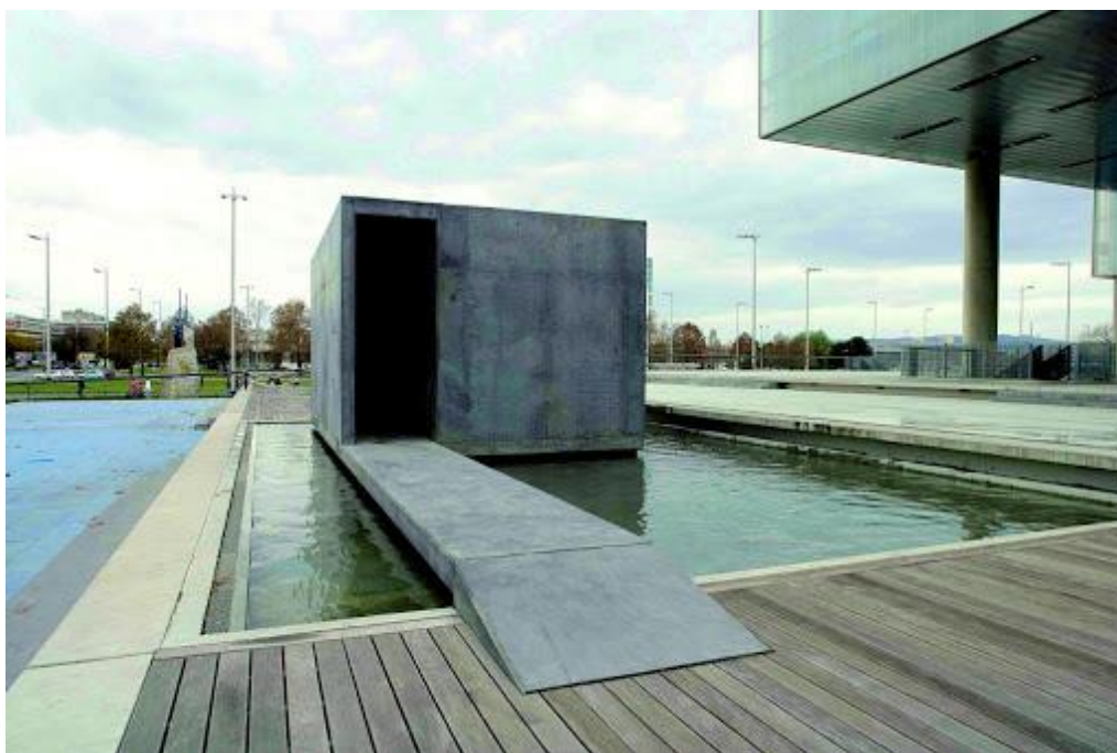
MIROŚŁAW BAŁKA: OČI PROČIŠĆENJA, 2009.

Njegovo djelo naziva Oči pročišćenja nalazi se na južnoj platformi ispred ulaza u Muzej suvremene umjetnosti. Pri svom radu Bałka razmišlja o posjetitelju, promatraču svojih djela te nastoji kreirati rad u kojem stavlja u blizak i intiman odnos djelo i promatrača. U konkretnom slučaju djela pred ulazom u Muzej suvremene umjetnosti Bałka promišlja o bučnoj prometnici i križanju ispred MSU-a i posjetitelju opterećenom nervozom prometnice te kreira meditativni prostor kojeg sačinjava betonski prostor u kojem atmosferu kontemplativnog, nematerijalnog i neopipljivog stvara pomoću vode koja cirkulira uokolo i unutar prostora.