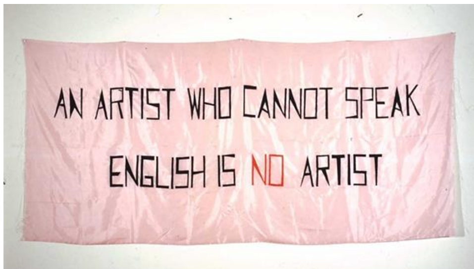
MLADEN STILINOVIĆ: AN ARTIST WHO CANNOT SPEAK ENGLISH IS NO ARTIST, 1993.

Vrijeme je to kada, nedugo nakon pada Berlinskog zida, kad umjetnici iz istočne Europe postaju sve prisutniji na umjetničkoj pozornici zapada, ulazeći u sustave umjetničkog tržišta. Preduvjet snalaženja u novim uvjetima jest poznavanje engleskog jezika: tradicionalni jezici umjetnosti i filozofije, poput francuskog, talijanskog, njemačkog ili ruskog izgubili su primat. 5