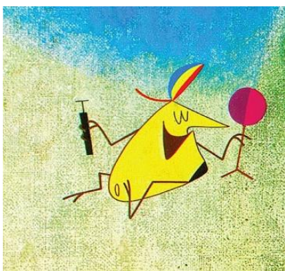
Dušan Vukotić, Surogat

Predstavljamo vam primjere crteža s izložbe „Od imaginacije do animacije: šest desetljeća Zagreb filma“. Stvorite sebe na papiru uz pomoć crteža i vaše mašte. Oživite vaše snove i zapamtite da na crtežu uistinu možete imati krila, letjeti, smanjiti se ili narasti u trenu, odnosno izgledati onako kako samo možete zamisliti. U crtanim filmu sve je moguće, čak i ono što u stvarnosti nije!