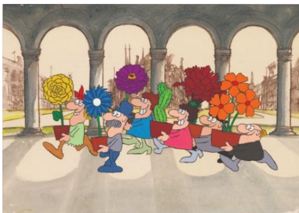
Borivoj Dovniković, Ljubitelji cvijeća

Vaša priča može biti izrazito smiješna, prava komedija, može biti ljubavna, a možete i izmisliti neki novi svijet u kojem možete postati čarobnjaci, vile ili čudovišta. Također uzmite u obzir da je kod animiranih filmova zanimljivo što vrlo lako možemo zamisliti i nacrtati sve ono što u stvarnom životu možda i nije lako ostvarivo.