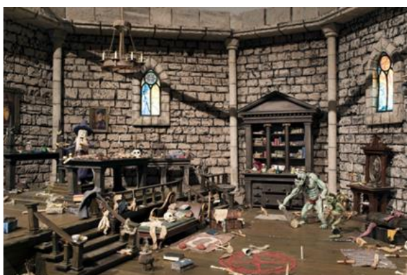
Scenografija za film Posljednji izazov u produkciji Zagreb filma.

Izrežite, primjerice vrata i prozore, docrtajte ili nalijepite elemente, a poslužiti mogu i vaše igračke ili predmeti iz neposredne okoline pod uvjetom da se uklapaju u priču.