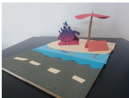
Dječji likovni rad - inspiracija Surogat

Radujemo se vašim radovima koje šaljite na e-mail edukacija@msu.hr .